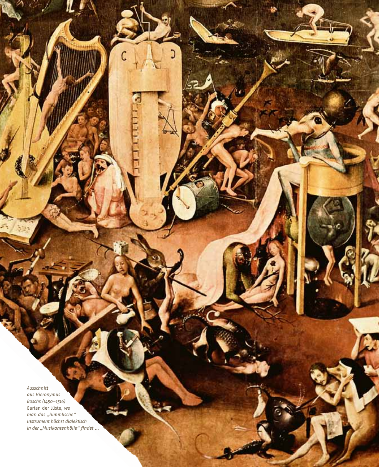
Ausschnitt aus Hieronymus Boschs (1450–1516) Garten der Lüste, wo man das „himmlische“ Instrument höchst dialektisch in der „Musikantenhölle“ findet ...