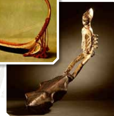
1 Ägypterinnen mit Doppelboje, Laute und Bogenharfe auf einer Wandmalerei in Theben, 18. Dynastie, 14. Jh. v. Chr. 2 Bogenharfe Saung aus Myanmar – 3 Bogenharfe der Mangbetu, Republik Kongo, mit üppigem Schnitzwerk