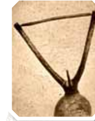
1 Toumani Diabaté aus Mali – einer der besten Koraspieler 2 Stegharfe aus Guinea 3 The Poozies beim TFF 1994