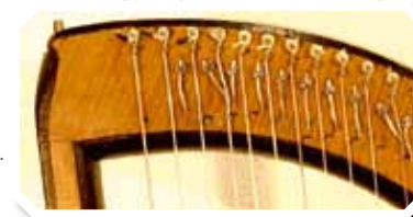
Detailsichten einer Pedalharfe, vermutlich aus der Werkstatt Jakob Hochbrückers, 18. Jh.