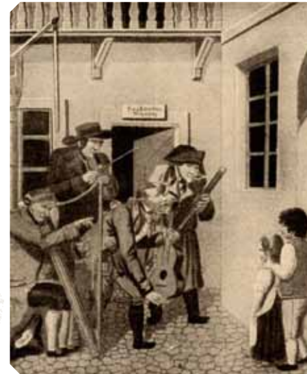
1 Egerländer Musikanten – 2/3 Harfe und Wanderkapelle aus Viggiano, Italien – 4 böhmische Straßenmusikanten